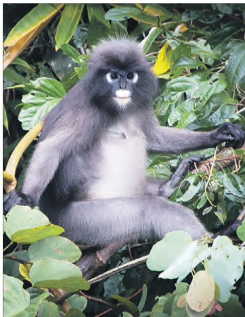
'n Langarmapie loer uit die oerwoud se ruigtes.