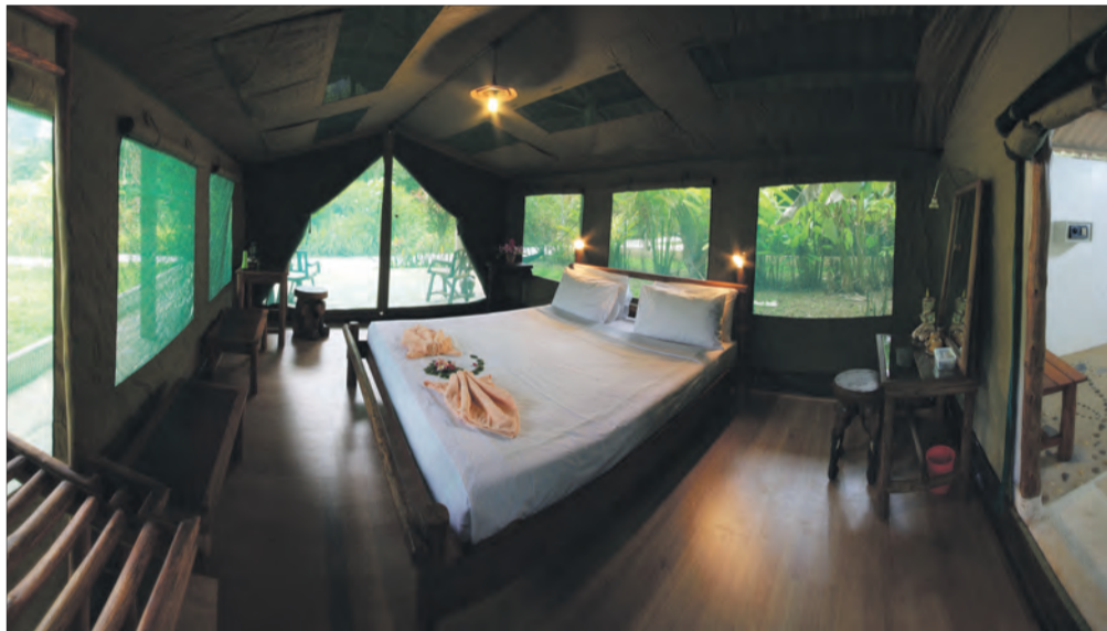
Die luukse tente en swembad in die hartjie van die oerwoud.