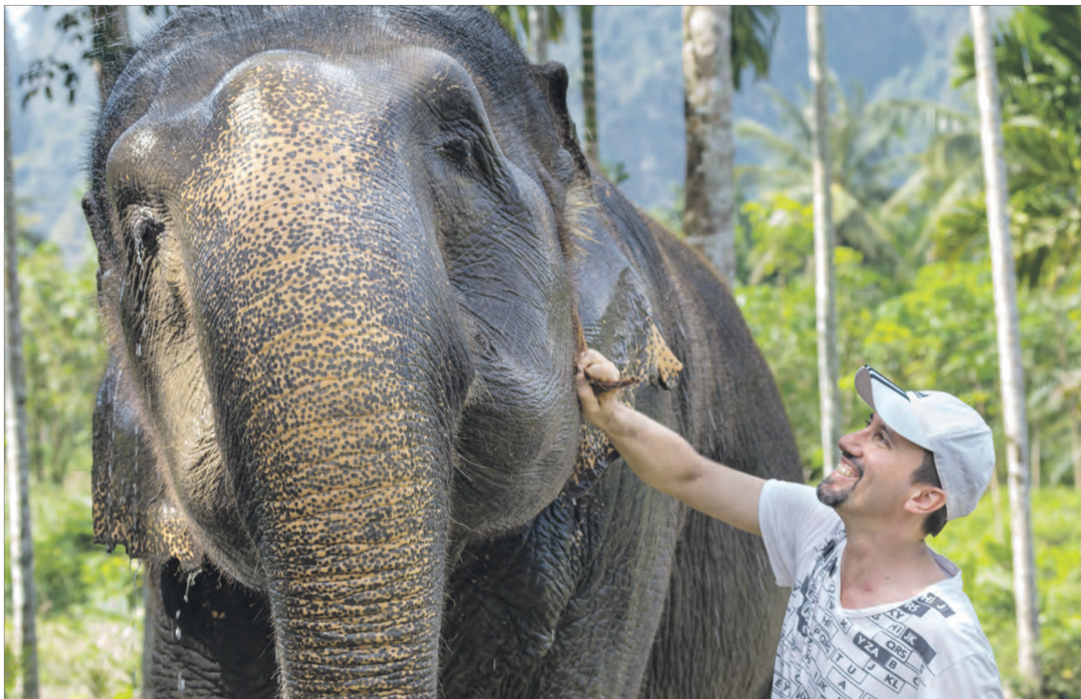
Gedurende die olifantervaring help besoekers om die olifante te was en vir hulle kos voor te berei.